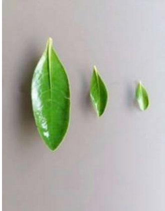
Réduction de la taille des feuilles